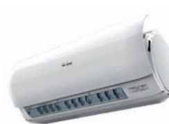
pannello motorizzato APERTO: H 370 x P 263 (mm) CHIUSO: H 318 x P 212 (mm)